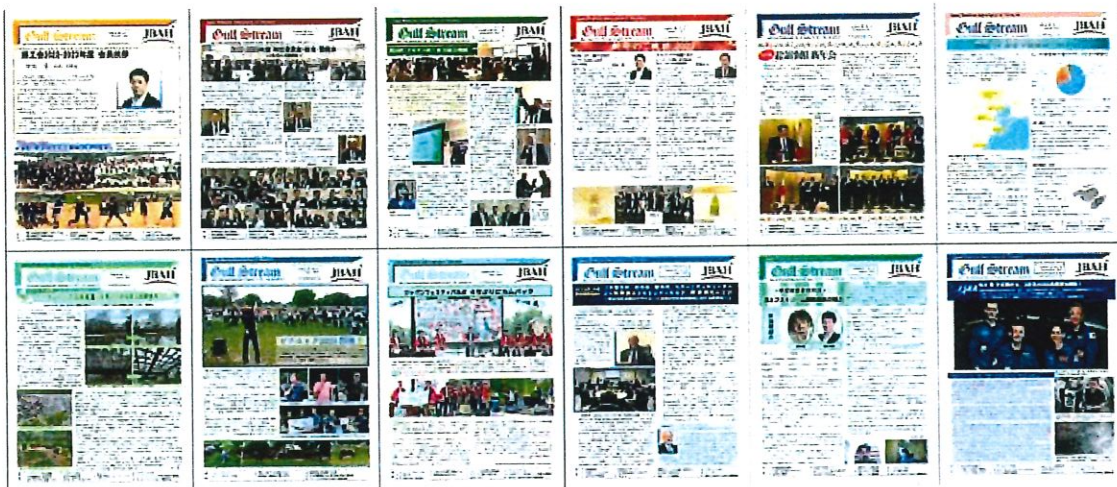
【2022-2023年度 Vol.48 No. 1~12】