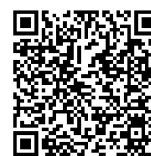
Raffle Donation Form

1880 S. Dairy Ashford Rd., Suite 170, Houston, TX 77077